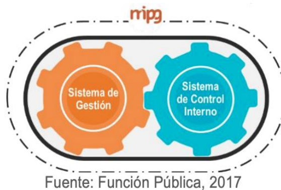
Gráfico 1. Articulación de los sistemas de Gestión y de Control Interno

En el Sistema de Gestión están contemplados todas las entidades y organismos del Estado, políticas, normas, recursos e información, cuyo objeto es dirigir la gestión pública al mejor desempeño institucional y a la consecución de resultados para la satisfacción de las necesidades y el goce efectivo de los derechos de los ciudadanos, en el marco de la legalidad y la integridad. El Sistema de Gestión se complementa y articula con otros sistemas, modelos y estrategias que establecen lineamientos y directrices en materia de gestión y desempeño para las entidades públicas, tales como el Sistema Nacional de Servicio al Ciudadano y el Sistema de Gestión de la Seguridad y Salud en el Trabajo, de Gestión Ambiental y de Seguridad de la Información.