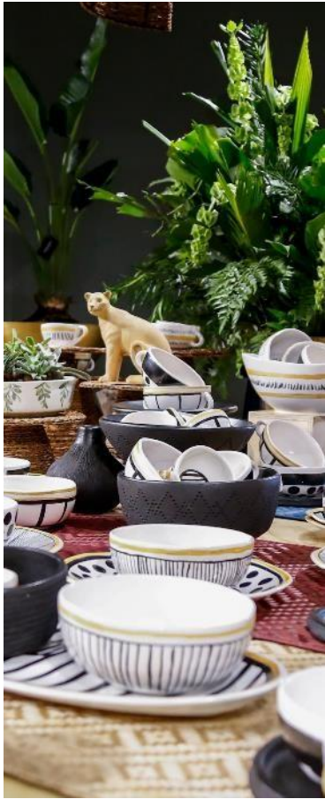
Hogar y decoración