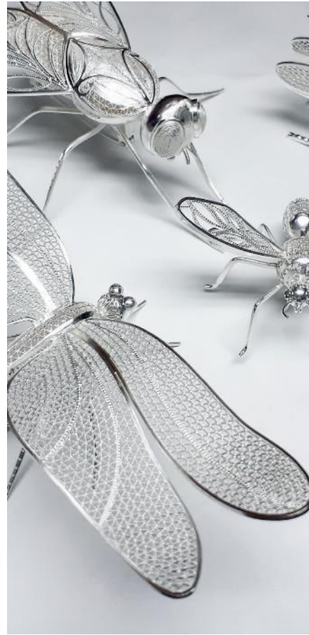
Joyería y bisutería