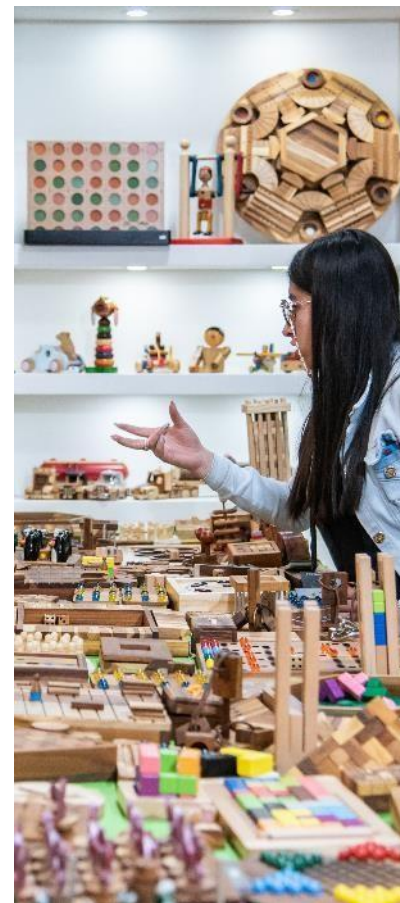
Infantiles e Instrumentos