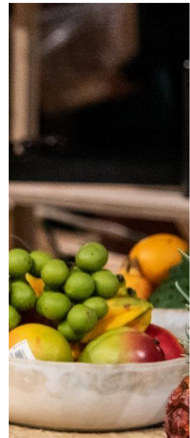
Bocados típicos y cocinas tradicionales