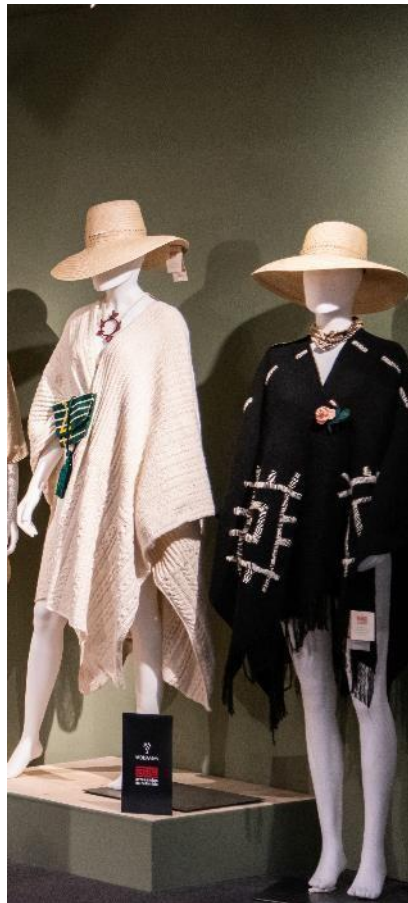
Moda y accesorios