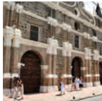
Calles en Santa Fe de Antioquia

• Es posible visitar las tiendas y las joyerías a través de un recorrido peatonal o contratando los servicios de un motocarro o un taxi, aunque el alquiler de transporte sí se hace indispensable para conocer atractivos como el río Cauca y el puente de Occidente. Pregunte también por los horarios de salida del transporte público colectivo.