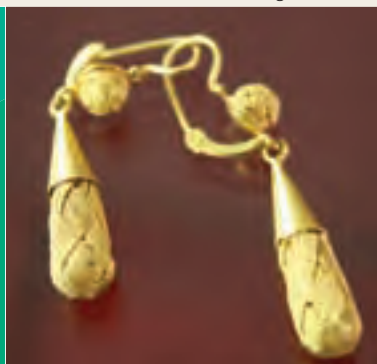
Aretes en filigrana

"El barequero pasó la mañana hurgando el agua y la arena del río en busca del precioso metal. La cánicula del mediocidia lo obliga a parar y a juntar los rescoldos de otras jornadas. El joyero lo espera, pesa y paga los reales, y en sus manos, el oro sigue ganando valor".