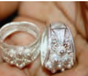
Anillos en filigrana