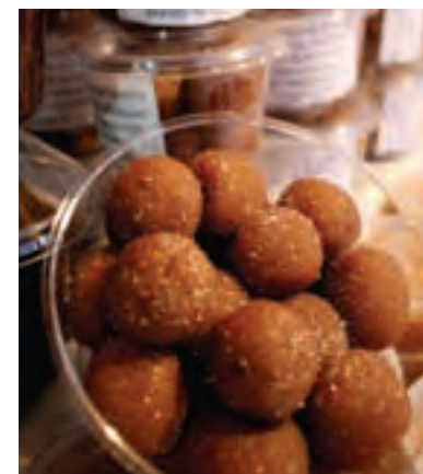
Dulces de tamarindo