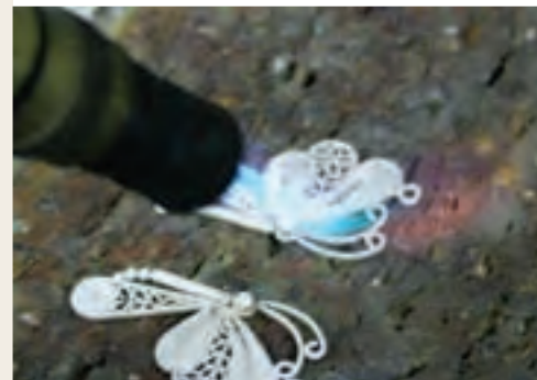
Trabajando la filigrana

Los artesanos han desarrollado otro tipo de tejido conocido como de espuma o estropajo que aplican a sus creaciones.