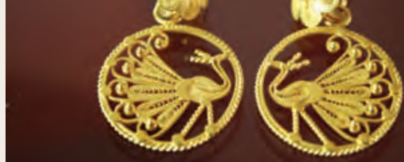
Aretes en filigrana en oro