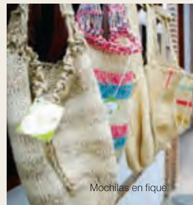
Mochilas en fique

Como parte de un plan de resocialización y de redención de penas, este oficio es desarrollado por los reclusos de la penitenciaría municipal, quienes a su vez capacitan a los nuevos internos para mantener una actividad que ya es costumbre. Los bolsos y mochilas en fique, lana e hilos de algodón que tejen los convictos se pueden comprar directamente en las instalaciones del penal.