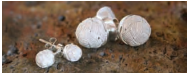
Aretes en filigrana

El pueblo mantiene su arraigo, las procesiones, la labor paciente del joyero, la verbena nocturna en la plaza y la canción y el servicio social que se anuncian por la emisora comunitaria.