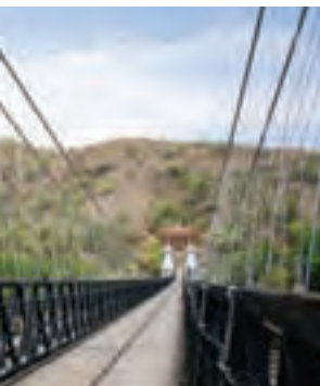
Puente de Occidente

Santa Fe de Antioquia fue declarado Bien de Interés Cultural en el año 1959.