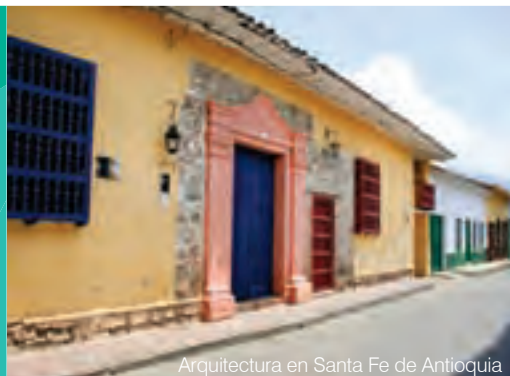
Arquitectura en Santa Fe de Antioquia

Santa Fe de Antioquia está 454 km al noroccidente de Bogotá y a 54 km al noroccidente de Medellín. Vía terrestre se llega por la ruta Bogotá - Honda - Puerto Salgar. Vía aérea hasta los aeropuertos José María Córdova de Rionegro o Enrique Olaya Herrera de Medellín.