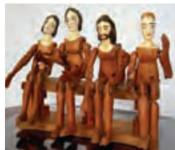
Objetos en madera