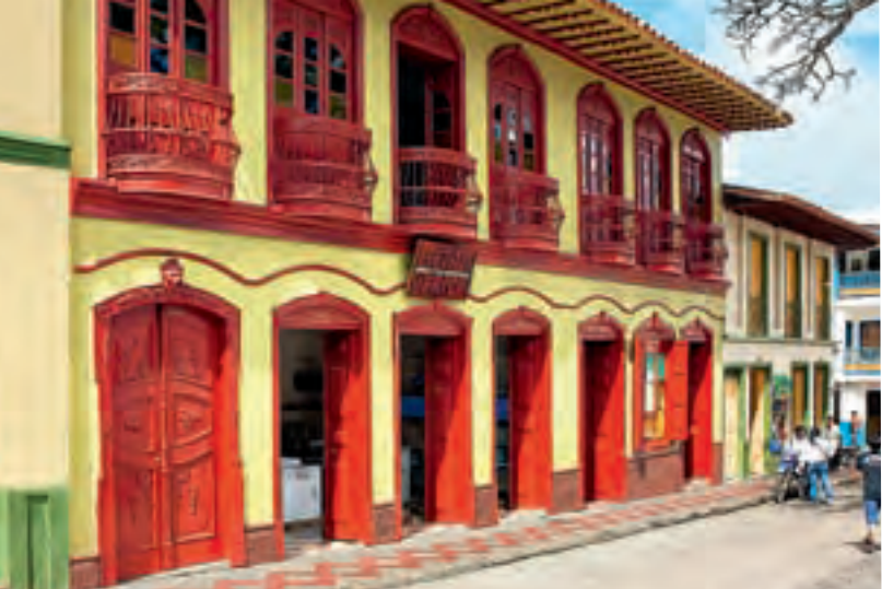
Arquitectura tradicional Jericó