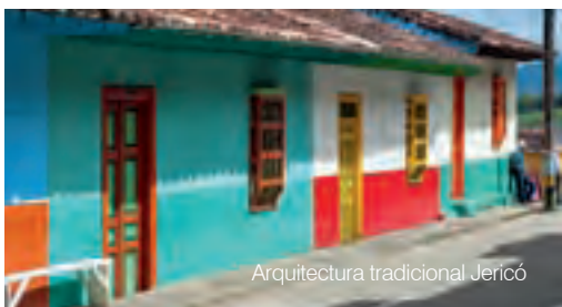
Arquitectura tradicional Jericó

Jericó fue declarado Bien de Interés Cultural en el año 1959.