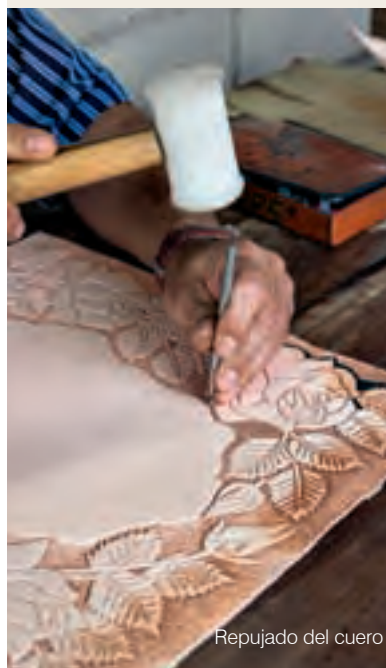
Repujado del cuero

En el carriel guardaban los campesinos los naipes, los dados, la barbeta, la navaja, la peinilla, el espejo, el escapulario, la aguja capotera, el tabaco y hasta las fotos de la novia, entre muchas cosas más.