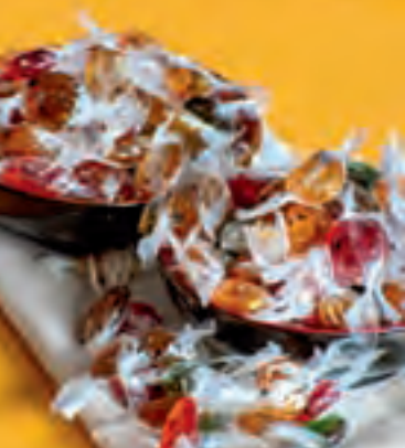
Dulces de cardamomo