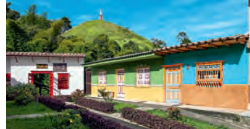
Puerta de entrada al Jardín Botánico Los Balsos

Además de la confección de carrieles, en Jericó se encuentran artículos derivados del cuero como sandalias, billeteras, cuadros, repujados, bolsos, estuches de navajas y celulares, correas, adornos y accesorios para mujeres, entre otros.