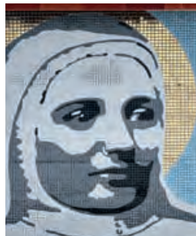
Mural Casa Natal de Santa Laura Montoya

Algunos artesanos aprovechan principalmente las rocas del río Piedras para esculpir piezas, una labor que se calcula en más de cien años. A punta de cincel se tallan bateas, caballos, lagartijas, ranas, bandejas y adornos en general. También elaboran elementos de mayor tamaño como ornamentos para jardines