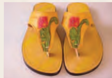
Sandalias en cuero