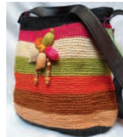
Artesanía en fique

Desde hace algunos años se ha incrementado el cultivo del fique en Jericó, debido a la aceptación que tienen las artesanías elaboradas en esta fibra. Varios artesanos se dedican a confeccionar toda clase de artículos con lindos diseños y mucha creatividad. También mezclan el cuero con el fique para innovar en los productos. Así mismo, están extrayendo el jugo del fique para elaborar productos de aseo y cuidado como los jabones multiusos, que son usados desde el cuidado del cabello hasta la limpieza de las ollas.