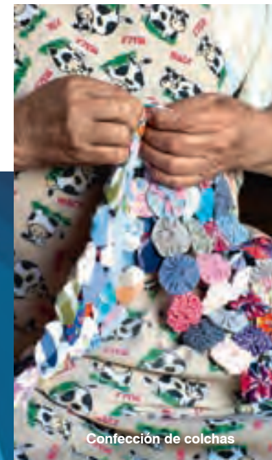
Confección de colchas

La tradición de la guadua también se hace presente en Jericó, por ello es usual encontrar en el pueblo artesanías elaboradas en este material como lámparas, ceniceros, bandejas, elementos decorativos y muebles.