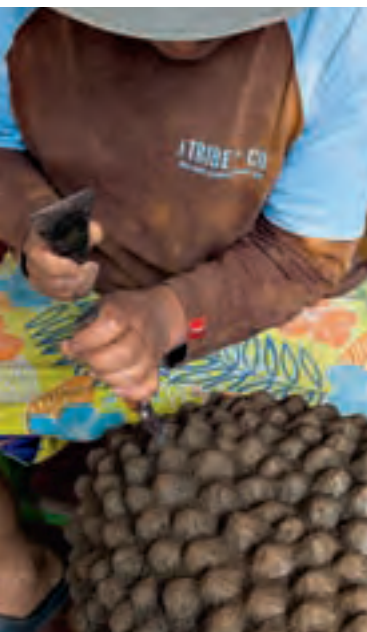
Talla de frutas en piedra